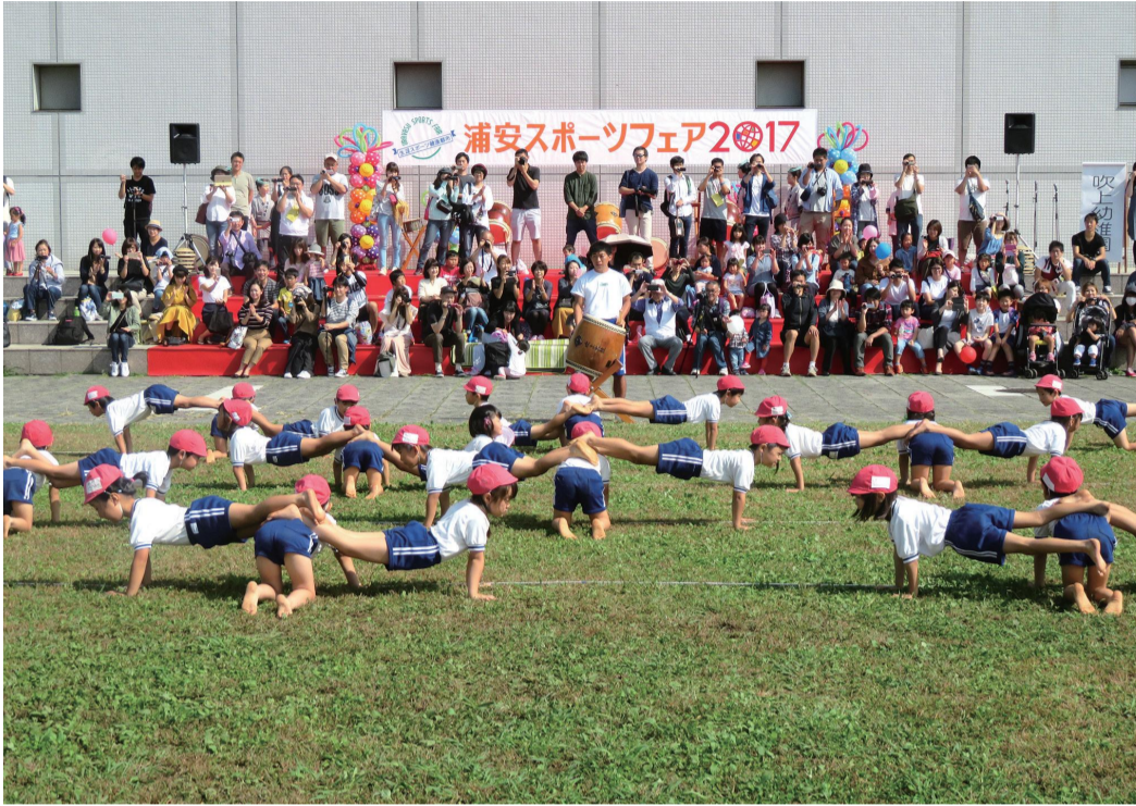
スポーツフェア2017で体操することもたち