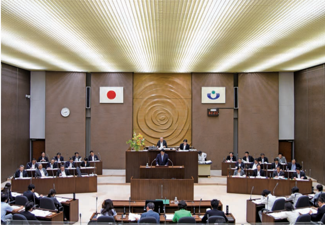
市議会議場 (平成27年5月18日第1回臨時会)

発行 浦安市議会 編集 うらやす議会だより編集委員会 〒279-8501 千葉県浦安市猫実一丁目1番1号 ☎047-351-1111 内線1804 URL http://www.kaigiroku.net/general/urayasusi/index.html