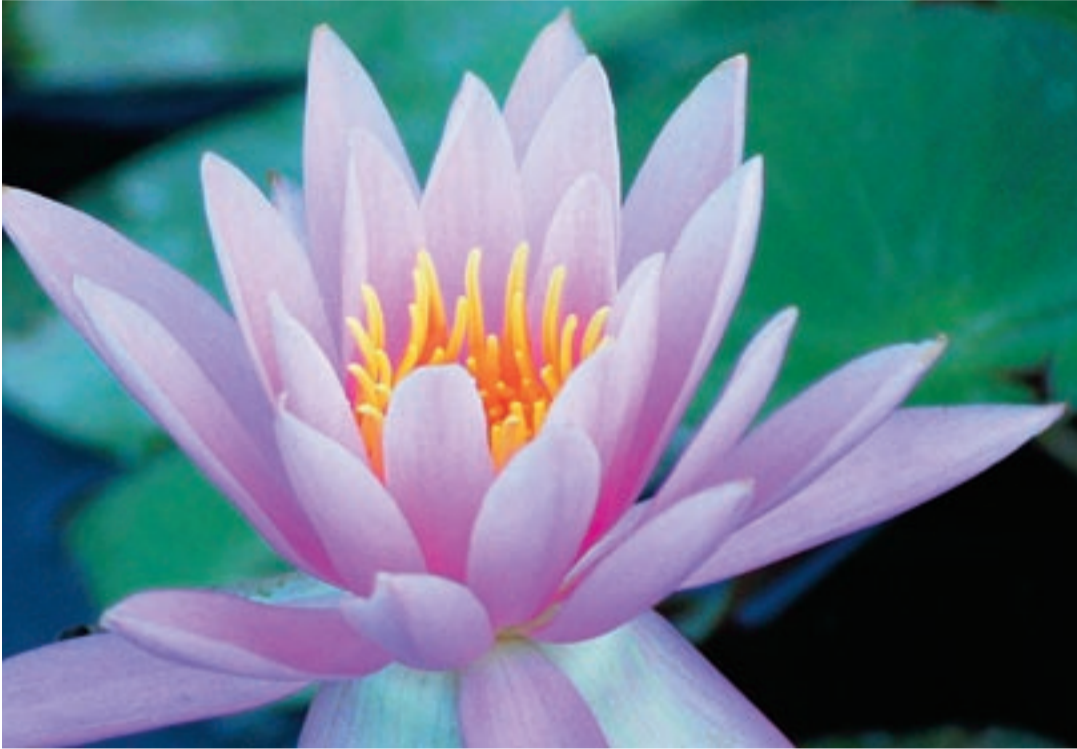
弁天ふれあいの森公園のスイレン

平成23年第1回臨時会は、5月18日に開催されました。この臨時会では、正副議長、千葉県後期高齢者医療広域連合議会議員の選挙や常任委員会委員の選任等、議会人事の決定を行いました。また、東日本大震災に伴う道路等の応急復旧等を行うため市長が行った平成22年度補正予算2件の専決処分、平成23年度補正予算3件の専決処分、ならびに健康保険法施行令等の一部改正に伴う専決処分1件を承認しました。