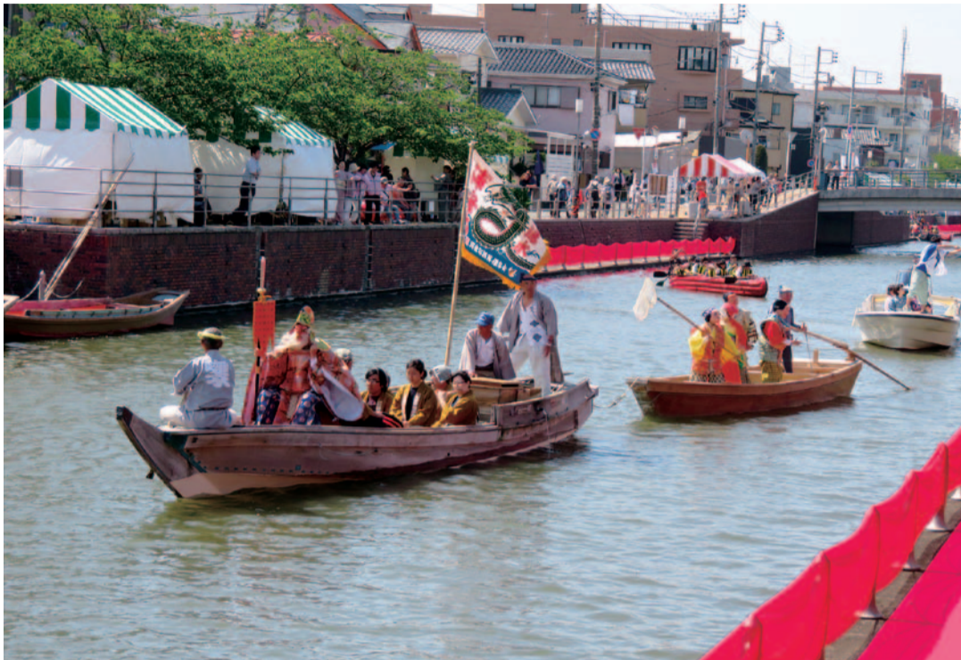
カフェテラスin境川2017で20年ぶりに復活した水神祭

平成29年第2回臨時会は、5月18日に開催されました。この臨時会では、正副議長、千葉県後期高齢者医療広域連合議会議員の選挙や常任委員会委員の選任等、議会人事の決定を行いました。また、条例の一部改正2件の専決処分が審議され、2件を承認したほか、人事案件1件が審議され、同意しました。